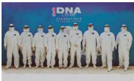
Dedicação, esforço e união marcaram o trabalho de toda equipe do DNA Center na fase mais crítica da pandemia. Todos trabalhando com um único propósito de salvar vidas.