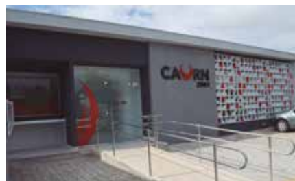
Clínica CAURN irá sediar atendimento da APS