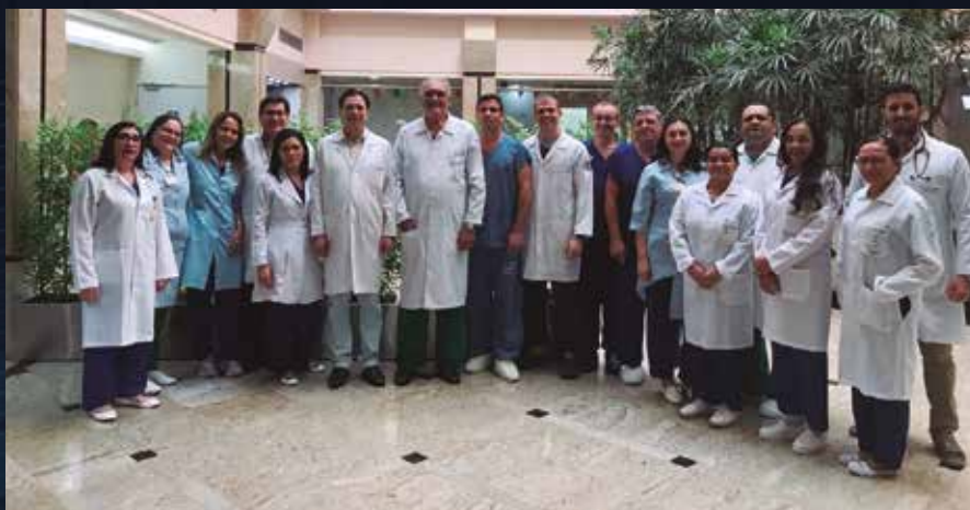
Equipe de Hemodinâmica do Hospital do Coração. (Foto feita antes da pandemia da Covid-19)

e como Cardiologista e Diretor do Hospital do Coração de Natal, faço aqui a minha recomendação para que continuemos firmes no uso da máscara, da higienização das mãos e evitando aglomeração em qualquer que seja a situação! Acreditamos que só após a vacinação da nossa população é que teremos o novo normal, haja vista todos os indicadores epidemiológicos alertarem para o aumento do contágio e grau de internação hospitalar pela Covid 19, desde o início do mês de novembro.