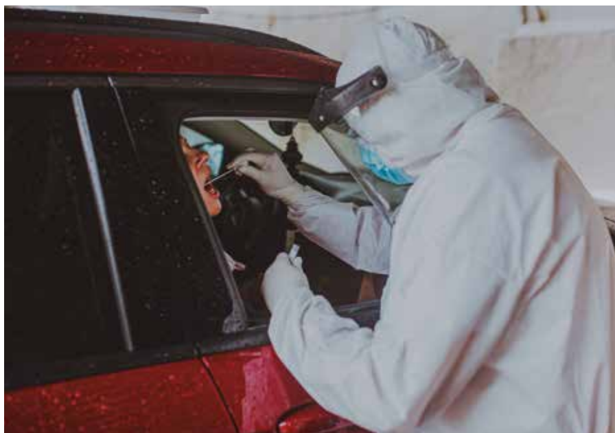
Toda a estrutura para a realização dos exames no sistema drive-thru foi montada em apenas 6 dias.